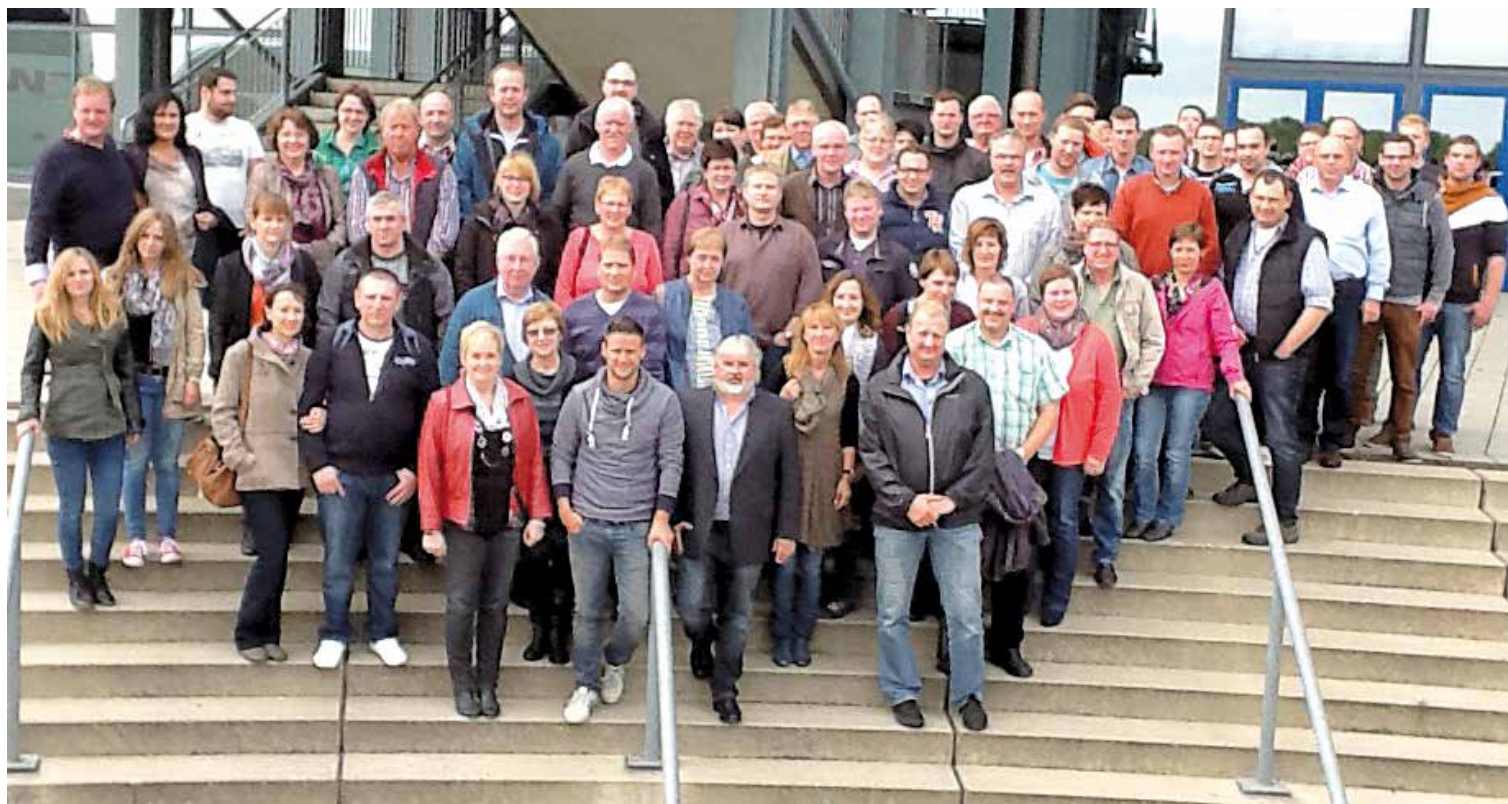
Oktober 2014 feierten wir das 90jährige Bestehen unserer Firma

Ein umfangreiches Angebot an Reifen und Schläuchen finden Sie in unserem Online-Shop.